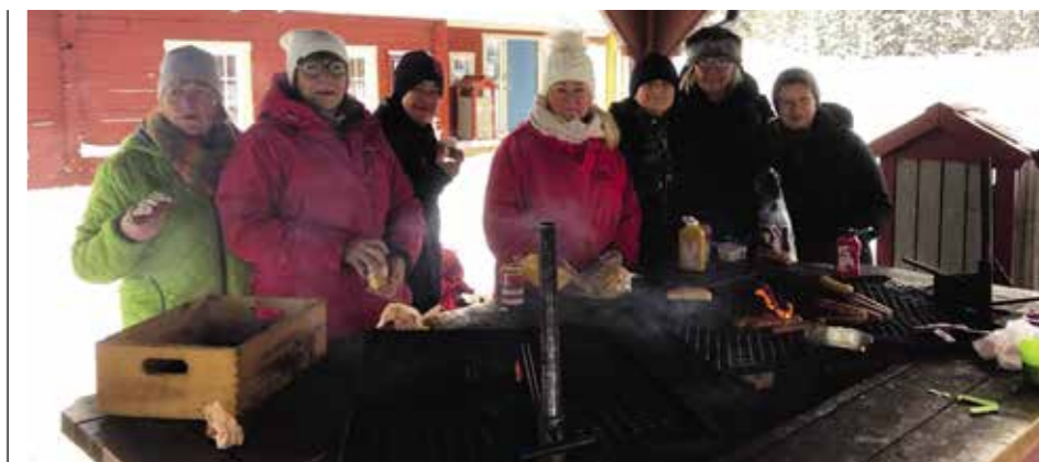
Troget gäng som åker till Vemdalen.

1. Jag gillade Kommunutmaningen 2018. Jag brukar också utnyttja rabatterna som personalföreningen ordnar. 2. Fler team-aktiviteter, så vi får göra saker tillsammans!